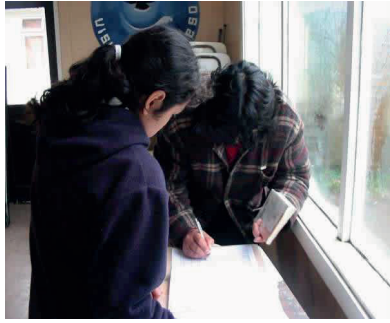
Devolución de Libros Curiñanco

Los alumnos van pasando al comedor de curso en curso, desde los más pequeños hasta los más grandes. Los más chicos son los que más disfrutan escogiendo los textos y varios conversan acerca de los libros y preguntan a sus compañeros si los han leído antes. Los más grandes se inclinan por las novelas cortas y los comics, "Asterix y Obelix" y "Ogú y Mampato" son los clásicos que Iván les trae.