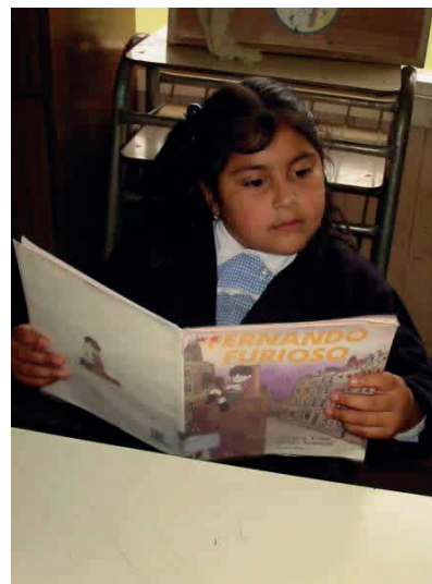
Alumno Escuela de Los Pellines