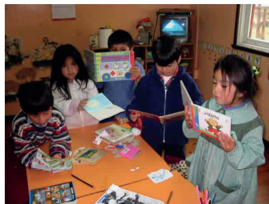
Alumnos Escuela de Los Pellines

11:50 de la mañana. Nos dirigimos a nuestro último destino, la Escuela Rural de Los Pellines, a unos 20 minutos de Bonifacio. Esta también es una escuela unidocente de primer a sexto año. Lo novedoso de ella –acota Iván– es que cuenta con un jardín infantil étnico, que partiendo desde los más pequeños intenta rescatar los orígenes mapuche de la mayoría de sus alumnos. Son 18 alumnos los que componen la escuela y 12 el jardín. Aquí la modalidad de préstamo es individual, pero en el jardín es de cajas viajeras.